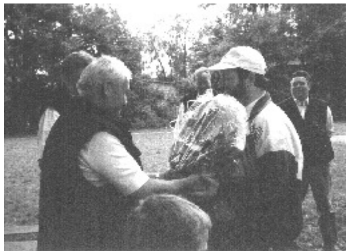
Der Löhmer Vereinsvorsitzende überreicht den Präsentkorb (Bild oben). Die Schützengilde Löhme hat sich viel vorgenommen (Bild unten).

ich dann mit etwas Glück tatsächlich alle fünf Flugbüchsen. Zum Schluß waren es auch fünf Teilnehmer mit diesem Ergebnis. Also ging es ans Stechen. Nochmals waren fünf Büchsen zu treffen, die Startreihenfolge wurde dazu ausgelost. Ich zog fast als letzter - und mußte zuerst schießen! Das Ergebnis war enttäuschend - wieder nur drei Treffer! Also wars wieder nichts, dachte ich. Mein Nachfolger schoß - zwei Treffer. Der Nächste - auch nur zwei Treffer. Langsam wurde ich unruhig und tigerte sichtlich nervös in der Menschenmenge umher. Der Vierte Schütze