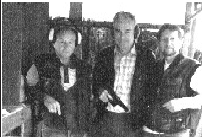
Der "harte Kern" der Seniorenschützen