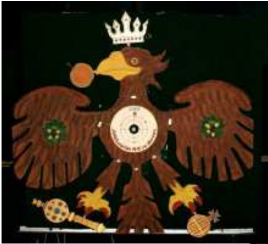
Beim Adlerschießen am 12. Dezember traf Schützenkamerad Willi Zandt das Zentrum des Adlers und wurde damit Adlerkönig 2003/2004